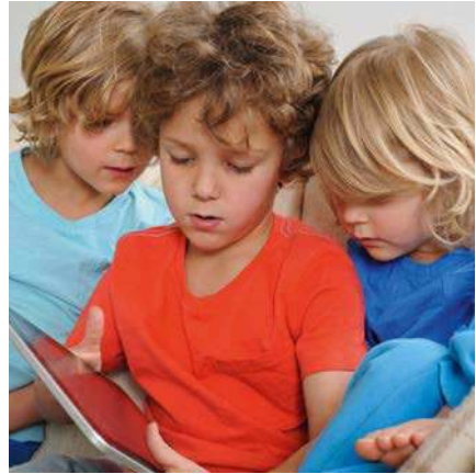
Tijdens het spelen raken de hoofden elkaar en kan hoofdluis zich verspreiden.

Hoofdluizen zoeken graag een warm plekje op; bijvoorbeeld in het haar achter de oren, in de nek of onder een pony. Kinderen krijgen gemakkelijk hoofdluis, omdat tijdens het spelen de hoofden elkaar soms raken. Hoofdluizen verspreiden zich ook makkelijk bij pubers. Dat kan bijvoorbeeld gebeuren bij het knuffelen, samen selfies maken of bij elkaar op de mobiel kijken.